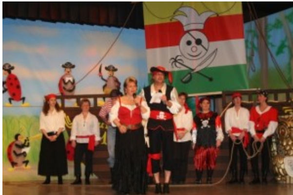
Piraten (Motto) Sitzung.

Es gab auch Veränderungen im Programm der Saalfastenacht. Die Familien – Kostüm – Sitzung bekam einen neuen Namen „Ramba – Zamba – Sitzung“ und anschließend „Motto Sitzung“. Diese neuen Namen und Ausrichtungen konnten aber nie mehr an die Erfolge der „Damensitzung“ anknüpfen.