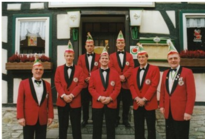
„Neukomiteeter im Jahr 2000“

Dieser Vorstand bestand zur Hälfte aus Damen und Herren und war sehr jung. Es begann nun bei den Kääwern eine sehr Zeit des Aufbruchs. Der Elan der jungen Vorstandstruppe fand nicht auf Antrieb den Weg in alle Köpfe und Herzen, hatte man doch lang gepflegte Vorgänge lieb gewonnen und es fehlte vielleicht an der ein oder anderen Stelle der letzte Mut, neue Wege einzuschlagen. Das neue Jahrtausend begrüßten wir Kääwern mit dem Grundsatz „Allen wohl und niemand weh“ und beschlossen, unsere Reihen wieder zu schließen“.