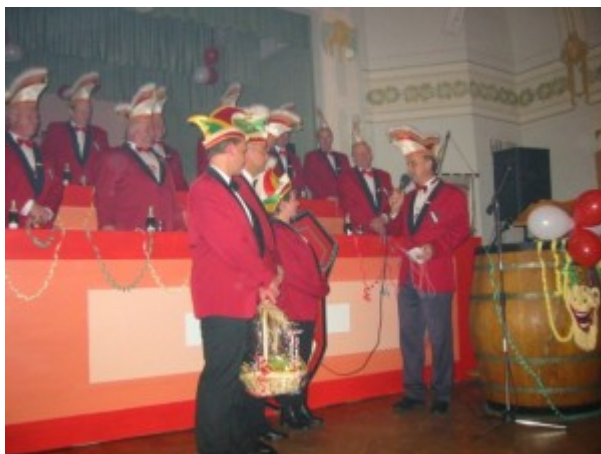
Start in die Kampagne 2002 im November 2001 in Haarhausen/Thüringen

Die Richtung der Saalfastenacht wurde gemeinsam besprochen und man wollte jetzt allen Unfrieden im Verein bereinigen. Im November feierten wir wieder mit unseren Freunden aus Haarhausen gemeinsam die Eröffnung der Kampagne 2002 unter der Leitung des neuen Präsidiums.