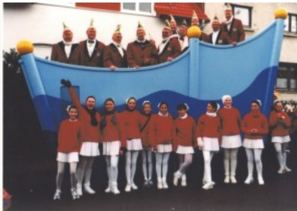
Unser neuer Komiteewagen in der Saison 2002

Der Vorstand und das neue Präsidium stellten die Weichen für eine erfolgreiche Zusammenarbeit. Der Komiteewagen, das Schlauchboot, das ein Käfer sein sollte, wurde entsorgt und gemeinsam bauten wir für die Saison 2002 einen neuen Wagen.